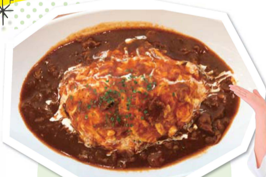
オムハヤシライス 400円